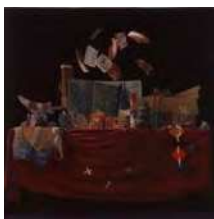
森弘志《それ、普通》 1994～95(平成6～7)年 当館蔵