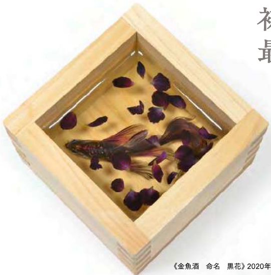
《金魚酒 命名 黒花》2020年